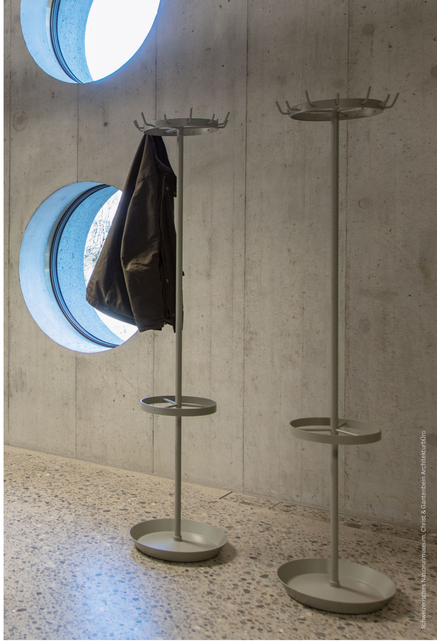
Schweizerisches Nationalmuseum, Christ & Gantenbein Architekturbüro