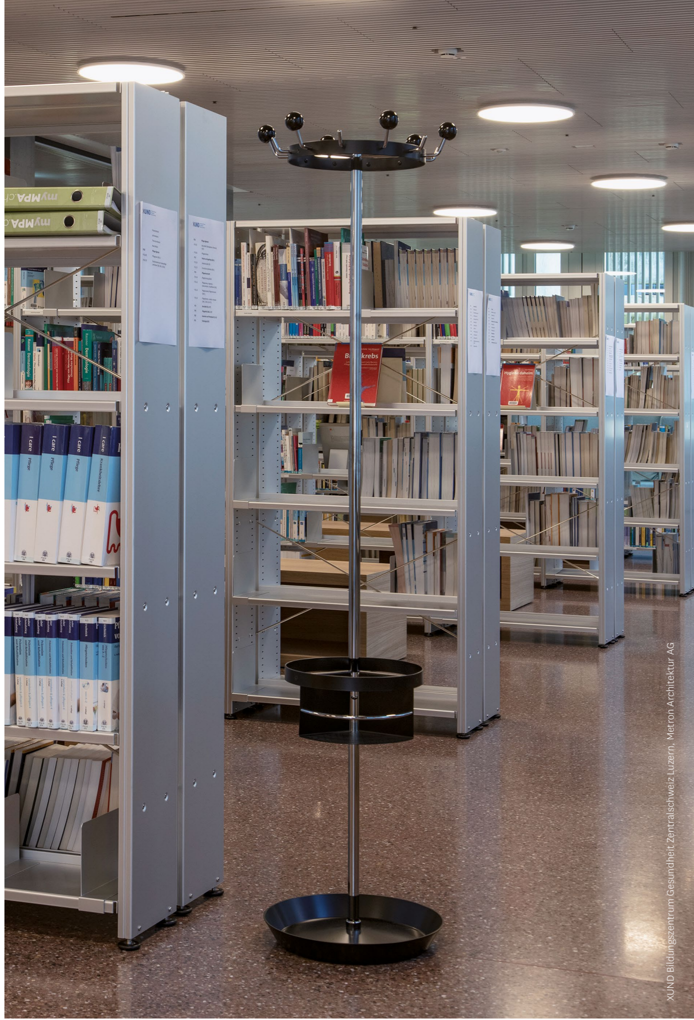
XUND Bildungszentrum Gesundheit Zentralschweiz Luzern, Metron Architektur AG